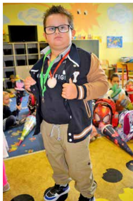
Malí školáci byli na své medaile náležitě pyšní.