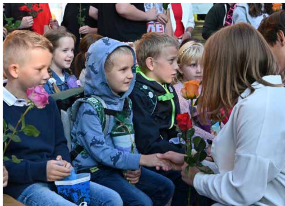
Kytička udělá radost malým školákům a doma určitě i maminkám