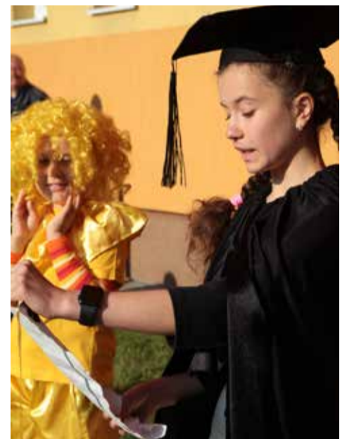
Ve Sluníčkové škole v Kadani děti i učitelé společně čarovali, aby se jim ve škole dobře učilo